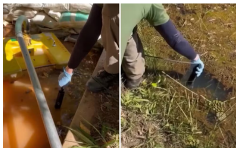
Link: AQUI Detecção: 20/08/2024 Ação: Não se aplica