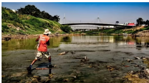
Foto: N/A, License Link: AQUI Detecção: 20/08/2024 Ação: Não se aplica

O Estado do Acre divulgou decretos oficiais que estabelecem situação de emergência em todo o território devido a incêndios florestais, elevação na emissão de fumaça e escassez, provocando o aumento brusco de doenças infecciosas bacterianas. O Decreto Nº 11.535 e o Decreto Nº 11.536 foram publicados no Diário Oficial do Estado (DOE) nesta terça-feira (20). Entre abril e agosto de 2024, o Acre enfrentou condições climáticas adversas, com baixos índices de precipitação, altas temperaturas e baixa umidade, que agravaram significativamente as condições ambientais. O número de focos de incêndio no estado aumentou em 185% em comparação ao mesmo período do ano anterior, com um total de 740 focos registrados em 22 municípios. Em julho, a elevação foi ainda mais acentuada, com um aumento de 184%, totalizando 603 focos. A dificuldade de acesso a municípios isolados têm dificultado o combate aos incêndios, além de contribuir para a degradação da qualidade do ar e o surgimento de problemas de saúde associados à poluição.