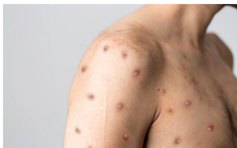
Link: AQUI Detecção: 18/08/2024 Ação: Não se aplica