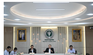
Link: AQUI Detecção: 22/08/2024 Ação: Não se aplica

Este é mais uma vez um caso "importado". A Tailândia confirmou que o caso de variola dos macacos (anteriormente conhecido como "variola dos macacos") detectado em seu território esta semana em um viajante da África vem da cepa africana responsável pelo surto atual. O Departamento de Controle de Doenças anunciou na quinta-feira que o teste laboratorial realizado no paciente, um europeu de 66 anos que chegou ao reino em 14 de agosto, confirmou que ele estava infectado com a cepa CLADE 1B.