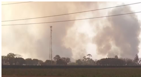
Link: AQUI Detecção: 24/08/2024 Ação: Não se aplica

O estado de São Paulo registrou mais de 2.300 focos de incêndios nos últimos dois dias e 36 municípios estão em estado de alerta. Aviões das Forças Armadas vão ajudar no combate às chamas. O resultado de tantos incêndios foi visto nas primeiras horas do dia. Cidades inteiras foram tomadas por uma densa cortina de fumaça. Muitos moradores saíram de casa de máscara. O Hospital das Clínicas de Ribeirão Preto estava cercado de fuligem. E a prefeitura suspendeu todas as atividades esportivas, inclusive jogos de futebol. Rodovias novamente foram interditadas por causa das chamas. Houve demora e transtornos.