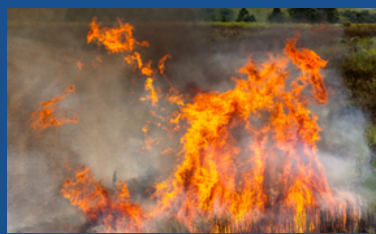
Link: AQUI Detecção: 24/08/2024 Ação: Não se aplica

Força-tarefa de fazendeiros usa aviões contra grande incêndio em Goiás