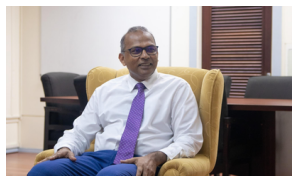
License Link: AQUI Detecção: 20/08/2024 Ação: Não se aplica

Os casos da infecção cresceram significativamente nas últimas duas semanas, quando o MINISTÉRIO tinha cerca de 6000 casos da doença transmitida por vetores em arquivo. Durante uma entrevista recente, o MINISTRO DA SAÚDE, Dr. Frank Anthony, revelou que vinte e seis mil testes foram feitos no ano passado, em comparação com 29.000 até agora em 2024. O setor de saúde pública está testando mais pessoas para a doença. O Dr. Anthony revelou que, recentemente, o ministério realizou 30.273 testes para dengue, com 8.021 retornando resultados positivos. Ele observou que dos casos positivos, 894 foram internados no hospital, com cinco mortes.