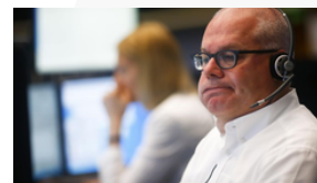
Link: AQUI Detecção: 26/09/2024 Ação: Não se aplica

A empresa biofarmacêutica australiana CSL garantiu um contrato no valor de 121,4 milhões de dólares do Departamento de Saúde e Serviços Humanos dos EUA (HHS) para expandir o estoque de vacinas contra a gripe aviária dos Estados Unidos para 40 milhões de doses. O anúncio foi feito hoje, detalhando o acordo plurianual que prevê o fornecimento pela CSL do seu adjuvante MF59, um componente-chave para a produção de vacinas contra o vírus da gripe aviária H5. A parceria com a Autoridade de Pesquisa e Desenvolvimento Avançado Biomédico (BARDA), uma divisão do HHS, visa reforçar a preparação do governo dos EUA para pandemias. O papel da BARDA inclui apoiar o desenvolvimento de contramedidas médicas para ameaças à saúde pública.