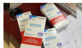
Link: AQUI Detecção: 25/09/2024 Ação: Não se aplica

A DoxiPEP, estratégia que consiste no uso do antibiótico doxiciclina em comprimidos como profilaxia pós-exposição (PEP) às infecções sexualmente transmissíveis (ISTs) é destaque em eventos nacionais e internacionais, com especialistas apresentando dados científicos de eficácia e segurança para prevenção de novas infecções por clamídia e sífilis e, com menor impacto, por gonorréia.