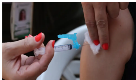
Link: AQUI Detecção: 25/09/2024 Ação: Não se aplica

Dados preliminares divulgados pelo Departamento do Programa Nacional de Imunizações (DPNI) apontam que apenas 27% dos adolescentes receberam a segunda dose da vacina contra a dengue em Goiás. De todas as 401 mil doses recebidas pelo estado, apenas 134,5 mil foram aplicadas e pouco mais de 37,5 mil pessoas voltaram para receber a segunda dose. O intervalo entre as doses da vacina deve ser de três meses e a população precisa ficar atenta à caderneta de vacinação para que a imunização completa seja garantida.