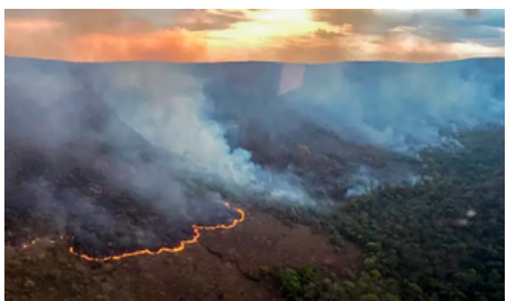
Link: AQUI Detecção: 26/09/2024 Ação: Não se aplica

Na tarde desta quarta-feira (25), novos focos de incêndio se espalharam pelo Parque Nacional da Chapada dos Veadeiros, próximo à Vila de São Jorge, a cerca de 430 km de Goiânia. Mais de 60 brigadistas do Instituto Chico Mendes de Conservação da Biodiversidade (ICMBIO), Ibama e voluntários estão mobilizados no combate às chamas. A concessionária PARQUETUR, responsável pela administração e preservação do parque, retirou em segurança todos os visitantes da área, incluindo aqueles que estavam acampados na região das Sete Quedas. Em nota oficial, o ICMBIO anunciou que, a partir de quinta-feira (26), todas as trilhas e atrativos do parque estarão fechados para visitação. A data de reabertura será informada posteriormente.