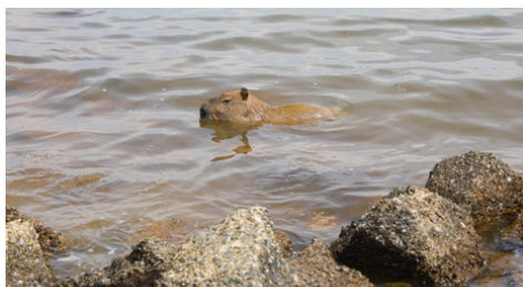
Link: AQUÍ Detecção: 04/10/2024

O tempo seco e quente no Distrito Federal é um aviso para tomar cuidado com a febre maculosa — doença infecciosa causada pela bactéria do gênero Rickettsia , transmitida pela picada do carrapato-estrela. É na estiagem que aumenta a reprodução e proliferação desses aracnídeos, que podem estar infectados com a doença. O tema ganhou visibilidade após a Secretaria de Saúde (SES-DF) confirmar dois pacientes do DF detectados com a febre maculosa. Até o momento, no DF, este ano, houve notificação de 59 casos – 40 descartados, 17 em investigação e dois confirmados.