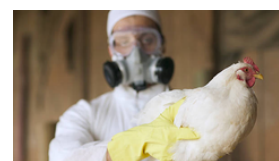
Link: AQUÍ Detecção: 29/10/2024

Um possível surto de infecções por gripe aviária no Missouri, Estados Unidos, cresceu para incluir oito pessoas, no que podem ser os primeiros casos de transmissão entre pessoas da doença já registrados. Se confirmados, o cenário indicará que o vírus adquiriu a capacidade de infectar humanos mais facilmente e, de forma inédita, de se disseminar entre eles.