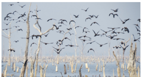
Foto: Weliton de Assunção/Governo do Tocantins Link: AQUÍ Detecção: 02/10/2024

O Tocantins é livre da Influenza Aviária (IA), doença altamente contagiosa que afeta as aves, e para continuar colaborando com a prevenção, sanidade do plantel e a saúde pública, o Governo do Estado, por meio da Agência de Defesa Agropecuária (ADAPEC) com o apoio do Instituto Natureza do Tocantins (NATURATINS) está realizando o mapeamento de sítios de aves migratórias na região centro-norte da Ilha do Bananal, entre os dias 30 de setembro e 4 de outubro. No Brasil, já foram registrados 166 focos da doença. Em maio deste ano, a ação foi realizada no Parque do Cantão, assim como será na Ilha do Bananal. Ambos estão catalogados pelo Instituto Chico Mendes de Conservação da Biodiversidade (ICMBIO), como sítios de descanso para aves migratórias.