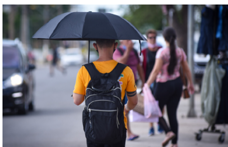
Link: AQUI Detecção: 29/09/2024

A chuva que caiu por várias localidades de Goiás na noite do último sábado (28) virou notícia em sites nacionais. “Depois de quase 160 dias, cidades de Goiás registraram chuva neste sábado. O Brasil vive a pior seca da série histórica, segundo análise do Centro Nacional de Monitoramento e Alertas de Desastres Naturais, do Ministério da Ciência, Tecnologia e Inovação”, diz a reportagem do O Globo. “Chuvas foram relatadas em municípios como Goiânia, Córrego do Ouro, Aparecida de Goiânia, Mineiros, Pirenópolis, entre outros.