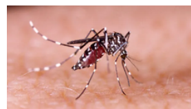
Link: AQUÍ Detecção: 07/10/2024

Na Região das Américas, o número de casos de dengue registrados durante o primeiro semestre de 2024 excedeu o número de casos historicamente notificados em um ano, em comparação com todos os anos registrados anteriormente. Até a semana epidemiológica 36 de 2024, 47 países e territórios na Região das Américas notificaram 11.732.921 casos de dengue; esse número é duas vezes e meio maior do que o número de casos notificados durante todo o ano de 2023, com 4.594.823 casos.