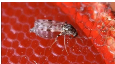
Link: AQUI Detecção: 10/10/2024

Em Pernambuco, três novas mortes de fetos infectados com o vírus da Febre do Oropouche foram registradas pela Secretaria Estadual de Saúde do Estado (SES-PE). As mortes ocorreram em julho, no Recife, capital do estado, e em Bom Jardim e Gravatá, no agreste. Com os registros, o total de casos de transmissão vertical do Oropouche no estado subiu para seis – uma das perdas fetais teve a causa de morte diretamente associada à doença. As informações foram divulgadas nesta quarta-feira (9). Em nota, a SES-PE informou que as Secretarias Municipais de Saúde das cidades com os novos casos confirmados já foram orientadas e devem iniciar a complementação das investigações, com o apoio das Gerências Regionais de Saúde (GERES) e da Diretoria Geral de Vigilância Ambiental de Pernambuco